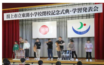
オープニング：おはやしクラブ演奏