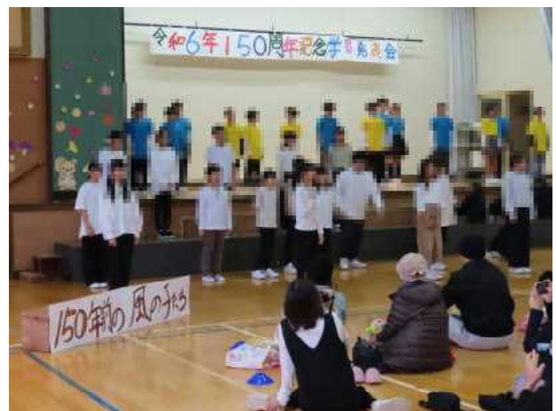
6年「われら風の子 ～未来の自分のための今～」