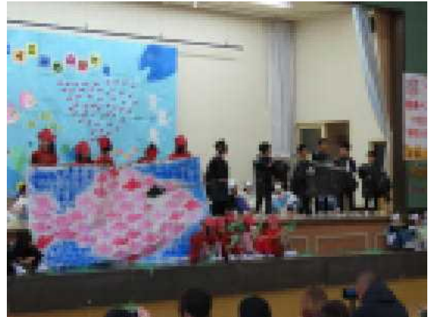
2年「スイミーものがたり」