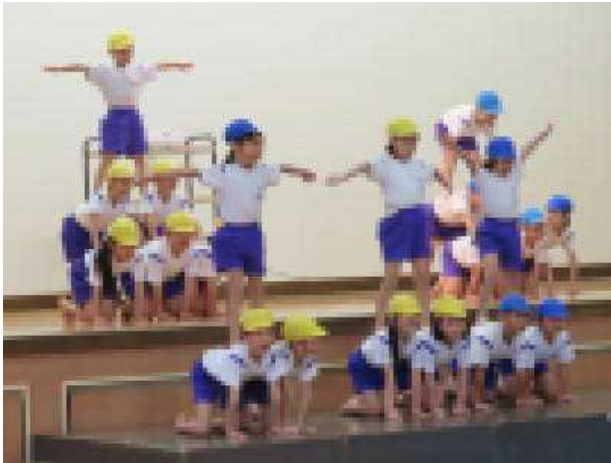
1年「元気いっぱい 風の子 1年生」