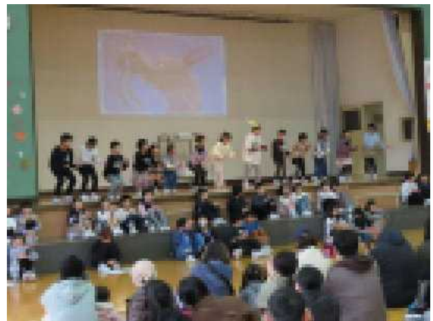
4年「風の子放送局 ～八郎湖を守るために～」