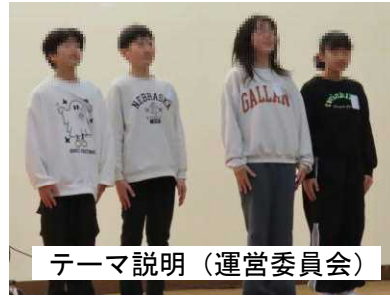
テーマ説明（運営委員会）

各学年が創立150周年への思いを込めた発表をそれぞれ披露し、会場から大きな拍手をいただきました。子どもたちはたくさんのお客様の前で練習の成果を披露することができ、退場の際の表情は満足感でいっぱいでした。