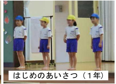
はじめのあいさつ（1年）