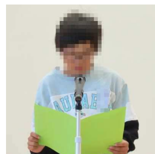
(左から) ○○○さん (2竹)、○○○さん (6松)、○○○○○さん (1松)、○○○○○さん (4松)