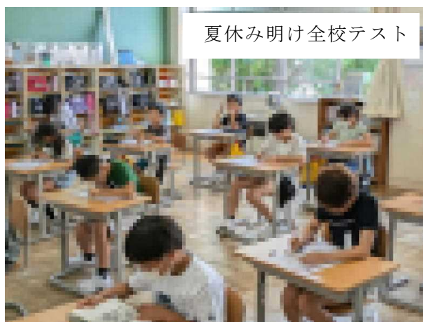
夏休み明け全校テスト