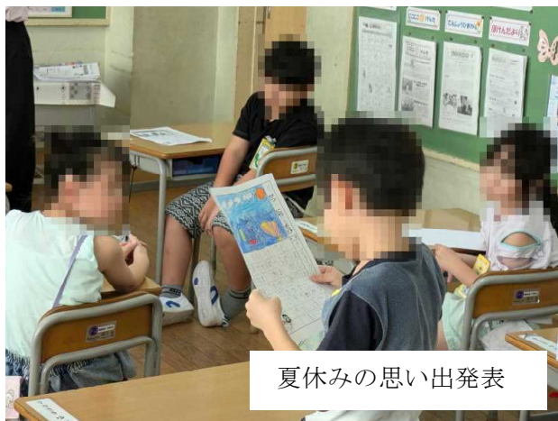
夏休みの思い出発表