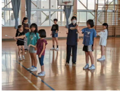
バトン (外部講師：〇〇〇〇さん)