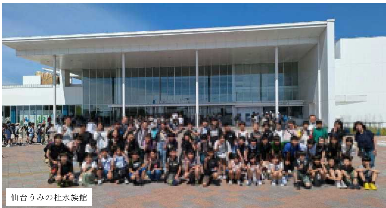
仙台うみの杜水族館

6月26日（水）・27日（木）、1泊2日の日程で6年生が修学旅行に行ってきました。2日間とも天候に恵まれ、スケジュール通りに活動できました。ちょっとしたハプニングはあったものの、事故なく、無事に帰ってくることができ、ほっとしています。出発までの準備や健康管理、送迎等、保護者の皆様には大変お世話になりました。ありがとうございました。