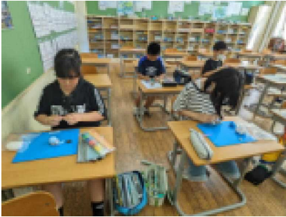
手芸・小物づくり

「学年や学級の所属を離れ、共通の趣味や関心を追求する活動を自主的に行う」ことをねらいに、4年生以上の子どもが11のクラブに所属して活動しています。今年度もバトンクラブとダンスクラブには外部講師を招くとともに、本校職員がそれぞれの趣味・特技を生かして子どもたちと一緒に活動を楽しんでいます。