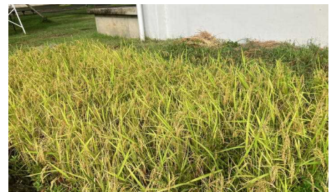
【校舎前ビオトープの稲が実りました】

約1か月半の前学期後半が終わると、後学期となります。今年、学校創立150周年記念式典もあります。大豊小学校の150歳を盛大にお祝いできるよう、子どもたちのパワーに負けずに私たち教職員も頑張っけて参ります。保護者の皆様、地域の皆様の一層のご協力をよろしくお願いいたします。