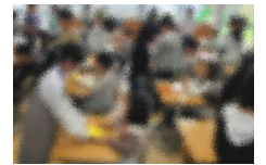
【4年・1年生を迎える会】