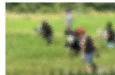
【5年・草木谷草取り】