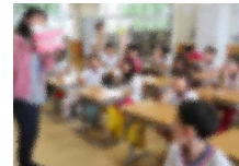
【3年・歯みがき指導】