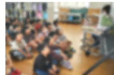
【1年・読み聞かせ会】

明日から子どもたちが楽しみにしている夏休みが始まります。学校創立150周年を迎えた今年度、保護者の皆様のご協力をいただきながらこれまでに運動会や記念講演会を実施しました。また、昨年度同様、見守り、クラブ活動、読み聞かせなどたくさんのボランティアの方々にもご協力いただいております。保護者及び地域の皆様のご支援・ご協力のお陰で、大きな事故や怪我もなく夏休みを迎えることができました。改めて感謝申し上げます。今年の夏休みは最後の土日を含めて34日間です。熱中症対策を心掛け、子どもたちにとって事故のない楽しい夏休みになるように、保護者及び地域の皆様のご協力をよろしくお願いいたします。