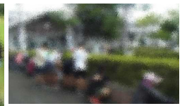
【6年・地域の方と草取り】