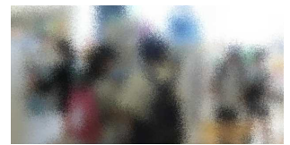
【楽しい買い物タイム】