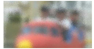
【ベニーランドにて】