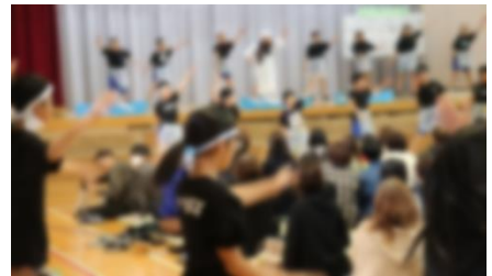
へいらっしゃい！出戸っ子寿司の回転だい（5年生）