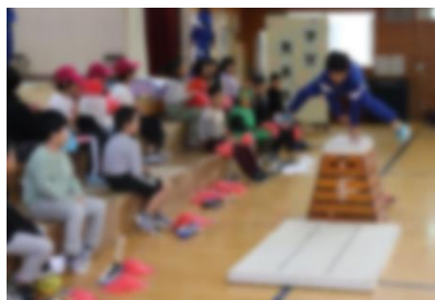
出戸っ子テレビ（3年生）