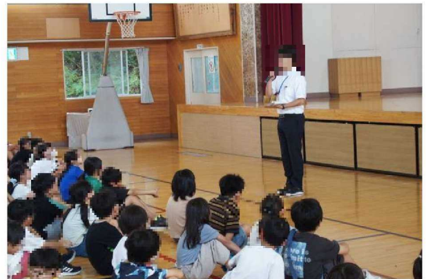
夏休み後の全校集会

「自分の命は自分で守る」子どもたちにとって、最も重要な学習です。正しい情報を入手すること、自分自身の体調をしっかりと管理すること等、適切に判断する力を身に付けさせたいと考えております。ご家庭でも、ご理解、ご協力をお願いいたします。